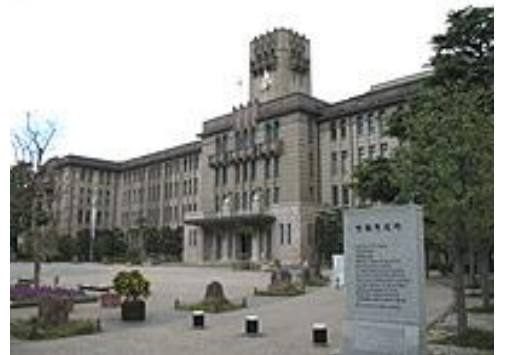
京都市は一体どこへ向かうのか？

そもそもお金が足りなくなった最大の要因は、政府に地方公務員の給与の引き下げを要請されたにも関わらず、京都市が引き下げに依らなかった為です。結果、予算不足が発生。簡単に言えば、公務員の給与引き下げに依らないばかりか、公務員の給与を将来のツケで支払うという暴挙に出たのです。