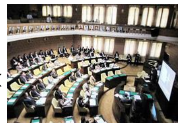
議会での海外視察報告会の風景

ちなみに、今般の視察は昔と違い、物見遊山でなく真面目な調査だったことは渡航した議員の名誉の為に付記しておく。